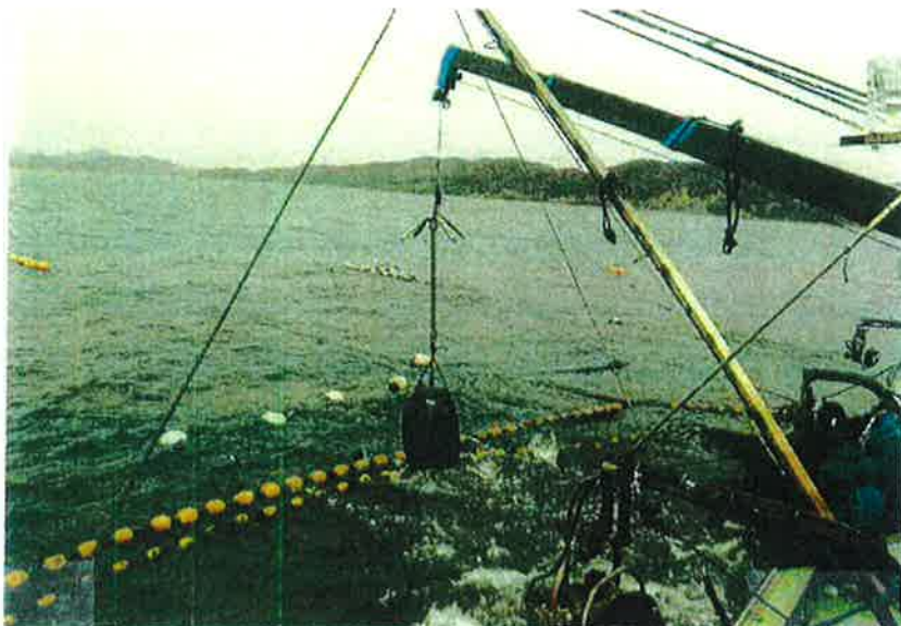
ステンレスイカリにサンドバッグ500kgを取り付けクレーンで魚捕部へ。