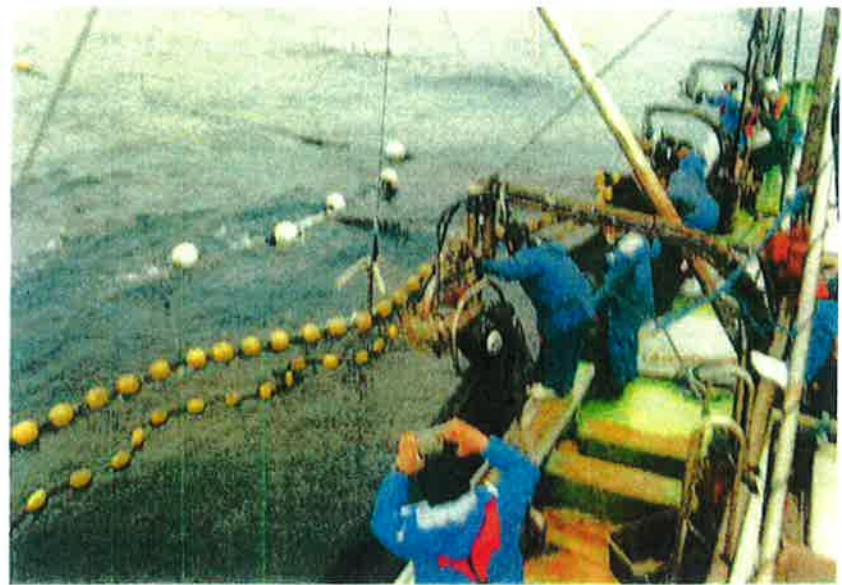
スルメイカの入網1500尾。ヨコワも見えなくなったところでサンドバッグを引き上げ、作業に入る